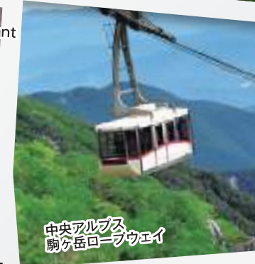
中央アルプス 駒ヶ岳ロープウェイ