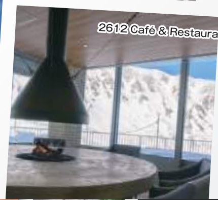
2612 Café & Restaurant