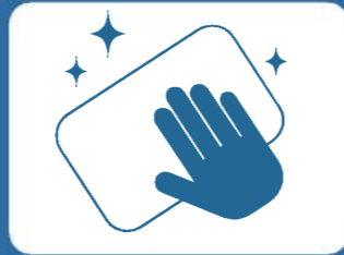
定期的な清掃・消毒