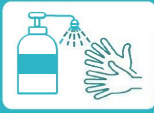
乗車時手指の消毒をお願いします