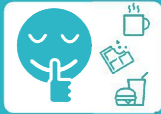
車内での飲食・会話はお控えください。