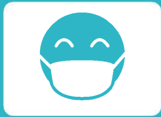
マスクの着用をお願いします