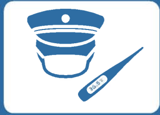
マスクの着用・健康管理