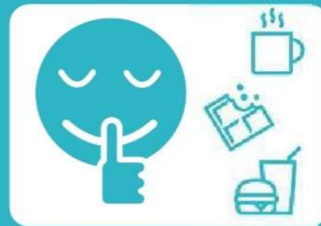
車内での飲食・会話は お控えください。