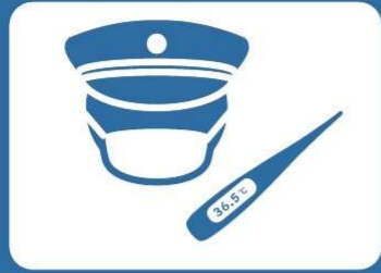
マスクの着用・健康管理