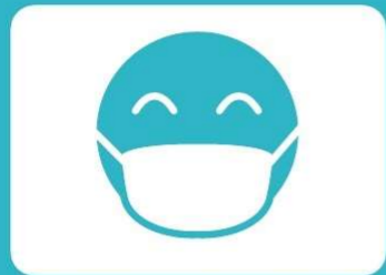
マスクの着用をお願いします