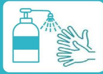
乗車時に手指の消毒を お願いします