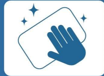
定期的な清掃・消毒